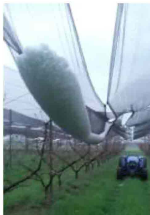
La grandine raccolta da una rete