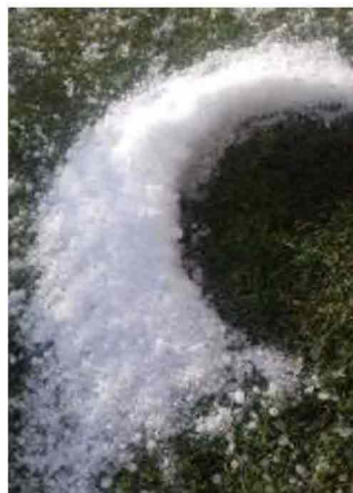
Un campo, ieri mattina