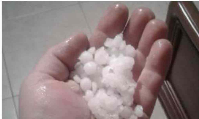
Chicchi di grandine: non erano di grandi dimensioni